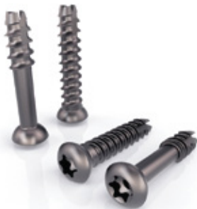
TORNILLO SLY PEQUEÑO

DISTAL FIBULA LOCKING PLATE - 2.7/3.5 MM