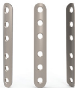
PLACA 1/3 DE TUBO DUO BLOQUEADA 3.5 MM

LOCKING ONE THIRD TUBULAR DUO PLATE 3.5 MM