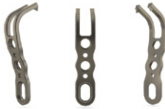
PLACA MALÉOLO MEDIAL H2