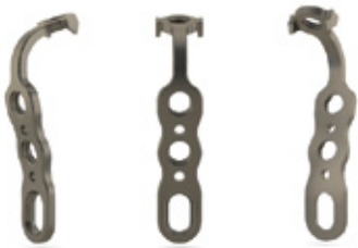
PLACA MALÉOLO MEDIAL H1

COMPLEMENTARY SYSTEMS - OSTEOSYNTHESIS ANKLE SYSTEM