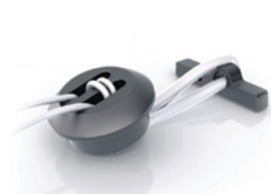
FLOOP - BUTTON LOOP REGULABLE PARA SINDESMOSIS DE TOBILLO

FLOOP - ADJUSTABLE BUTTON LOOP FOR ANKLE SYNDESMOSIS